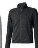
97 heather smoke